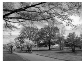
表紙写真：百合が原公園 (札幌市)の春